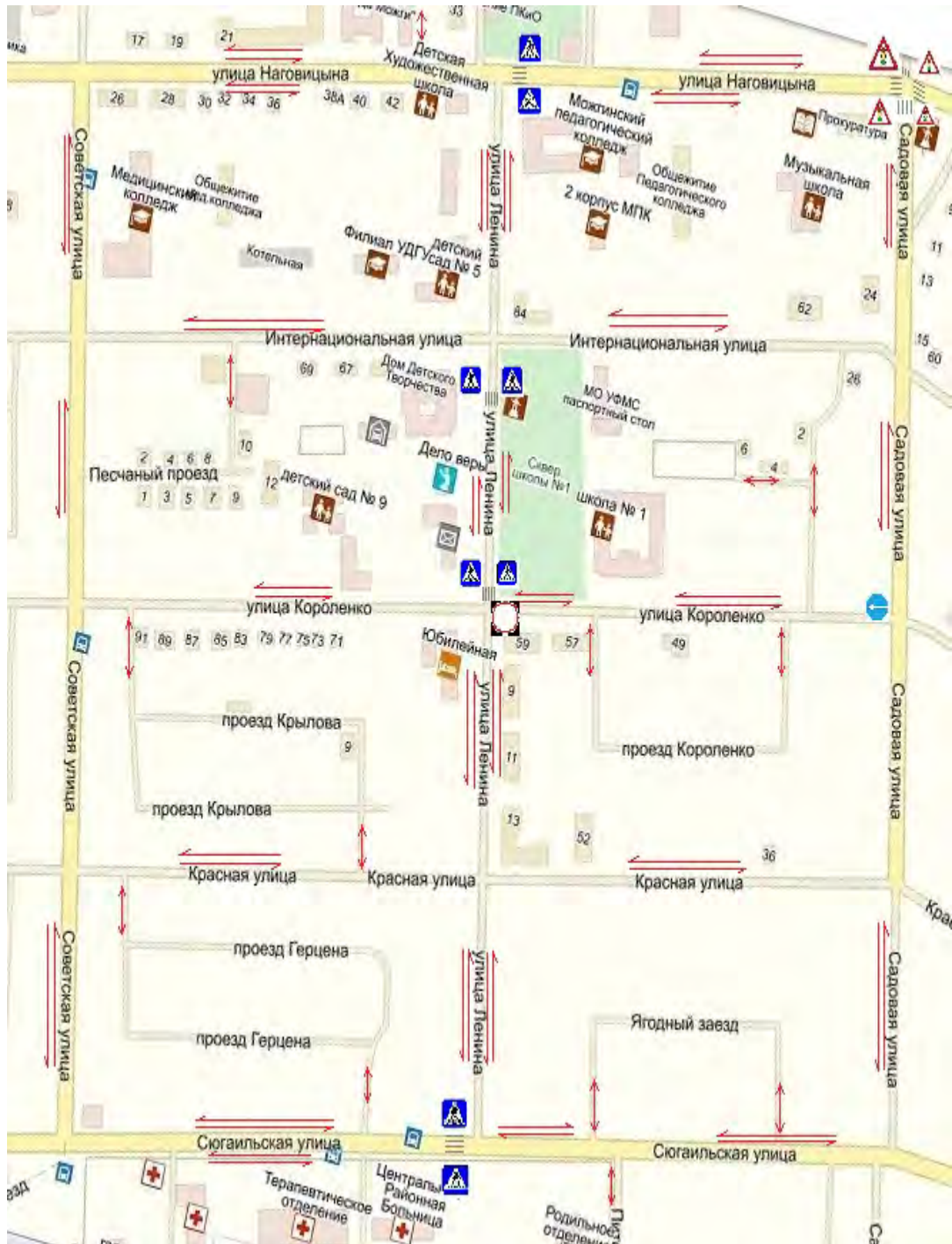
СХЕМА безопасного маршрута школьников к МБОУ СОШ № 1