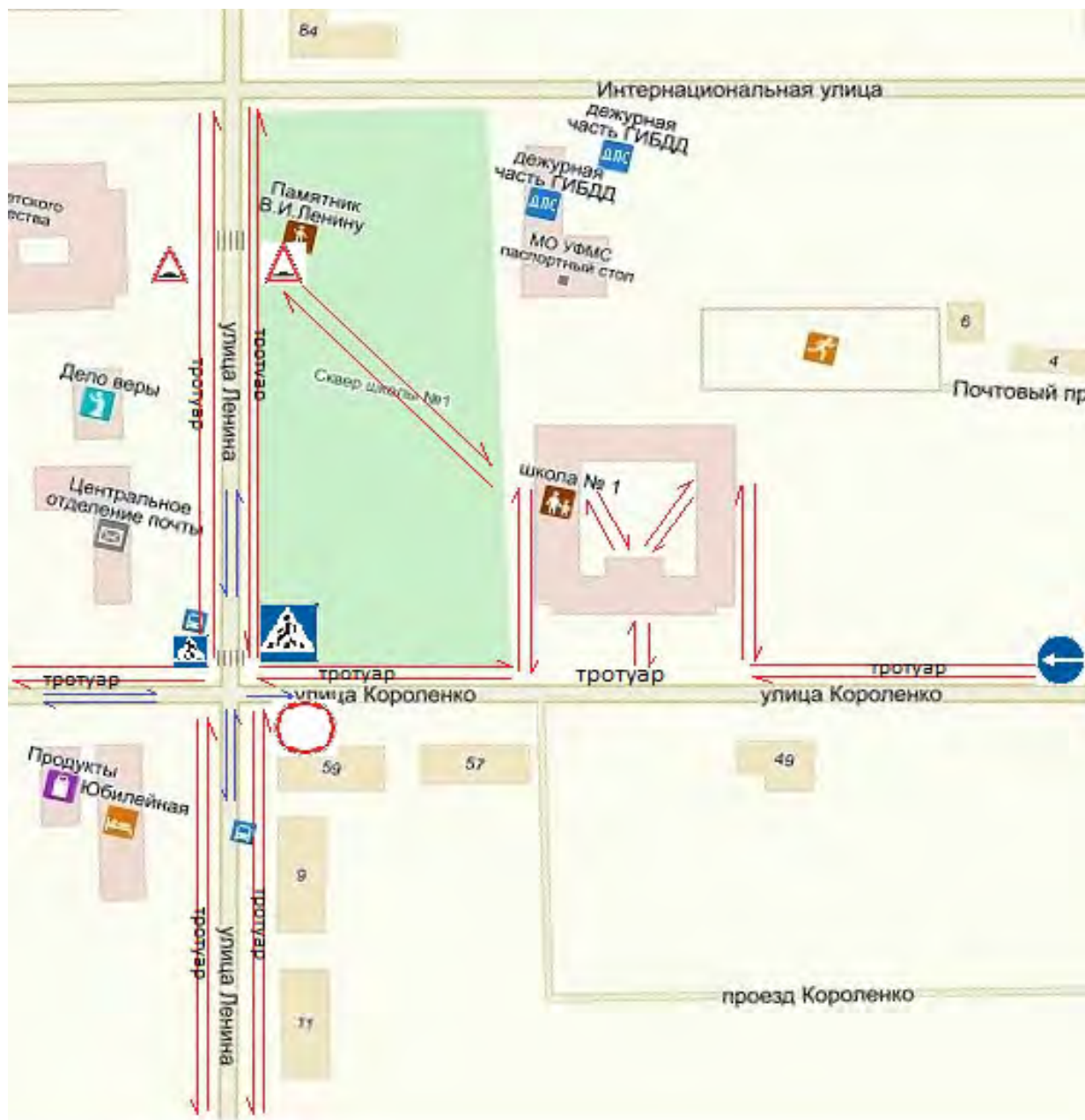
Схема подъездных путей и движения пешеходов к МБОУ СОШ № 1. Расположение дорожных знаков, технических средств регулирования искусственных неровностей, пешеходных переходов.